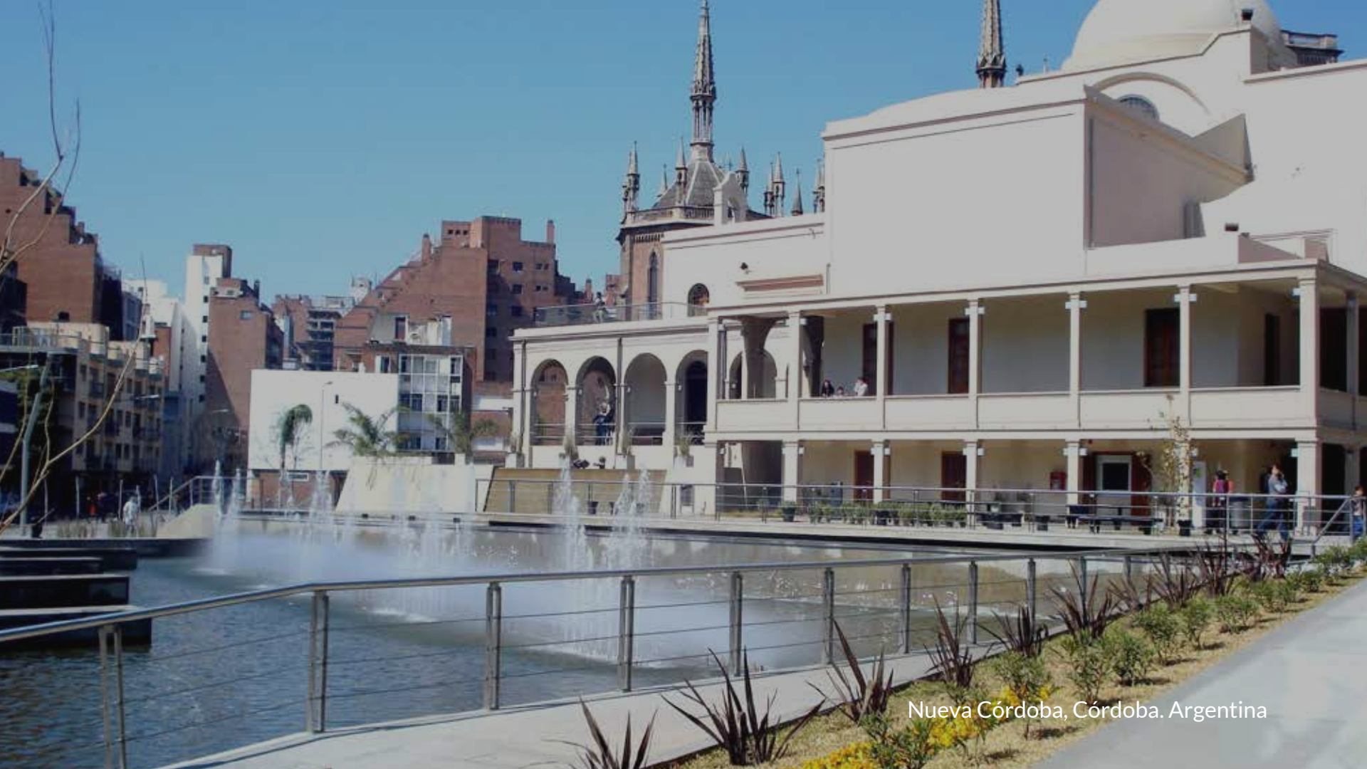
Nueva Córdoba, Córdoba. Argentina